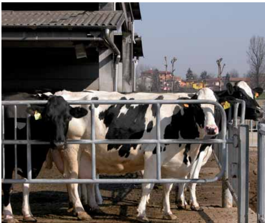
Punto di debolezza per eccellenza è la scarsa longevità produttiva. Attualmente le nostre Frisone in produzione hanno circa 56 mesi d'età e vengono eliminate all'incirca a 63 mesi di vita.

Partiamo dai punti di forza . Il nostro "rigido" sistema di con-