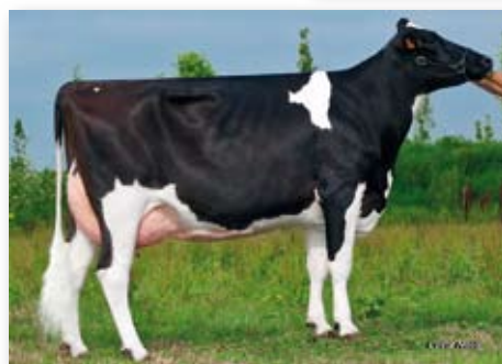
TRE STELLE GLAUCO UPERINA

L'UNICO FIGLIO DI DUPLEX DISPONIBILE IN UN MONDO DI